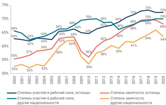
Схема 1. Степень трудовой занятости по национальности, 2000–2020 (население в возрасте 15–74 лет), %.

Показатели занятости жителей Эстонии до вспышки пандемии коронавируса находились на самом высоком уровне за последние 20 лет, и ситуация эстонцев и жителей другой национальности на рынке труда стали схожими. И все же изменения на рынке труда оказывают сильное влияние на занятость населения, а экономические кризисы привели к росту различий по национальному признаку. Для общества Эстонии в этой сфере по-прежнему важно понять, как разные национальности адаптируются к изменившейся социально-экономической ситуации и возможностям рынка труда.