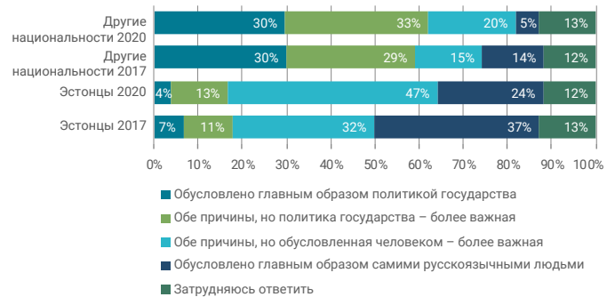
Схема 3. Ответы жителей на вопрос, обусловлено ли неравенство на рынке труда главным образом политикой государства или самими русскоязычными жителями, по национальным группам, %.

В то же время среди жителей другой национальности значительно больше тех, кто считает, что уровень жизни их семьи именно после пандемии коронавируса ухудшился. Если 75% эстонцев оценили, что ситуация с уровнем жизни семьи осталась прежней, и 21% ответили, что она ухудшилась, то по оценке 63% людей другой национальности ситуация осталась такой же, и по мнению 32% ухудшилась.