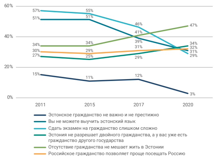
Схема 1. Ответы не желающих получить гражданство Эстонии о причинах этого.

Те, кто желает ходатайствовать о гражданстве, имеют хороший доступ к информации о том, что для этого необходимо сделать и какие обязательства и права влечет за собой гражданство.