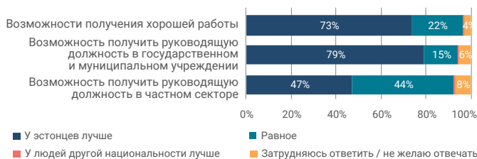
Схема 2. Ответы жителей другой национальности на вопрос «Как вы оцениваете возможности эстонцев и людей другой национальности в следующих сферах?».

Особенно остро ощущают различие в материальном благосостоянии живущие в Ида-Вирумаа люди другой национальности, из которых только 14% считают возможности равными и 83% считают, что положение эстонцев намного или немного лучше. И возможности получения хорошей работы, по оценкам представителей других национальностей, у эстонцев значительно выше (73%). Эти оценки по сравнению с 2017 годом существенно не изменились.