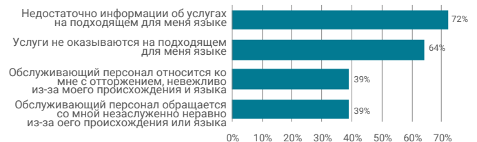
Схема 3. Причины того, почему жители другой национальности недовольны доступом к услугам.

Жители другой национальности недовольны доступностью услуг главным образом по причине языкового барьера.