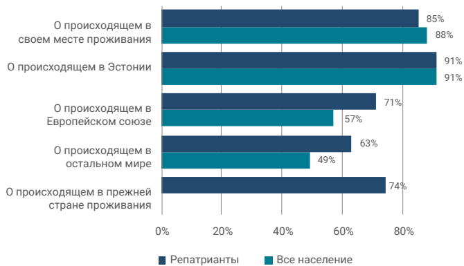
Схема 2. Оценка собственной информированности (ответы «Очень хорошо» и «Скорее хорошо»), репатрианты в сравнении со всем населением, %.

Помимо традиционных медиаканалов, репатрианты активно пользуются социальными медиа.